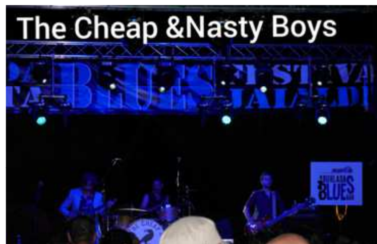
The Cheap & Nasty Boys