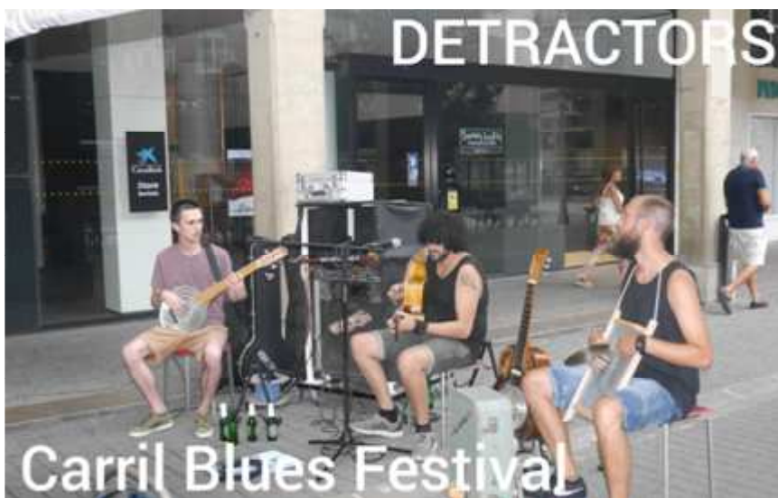
Carril Blues Festival