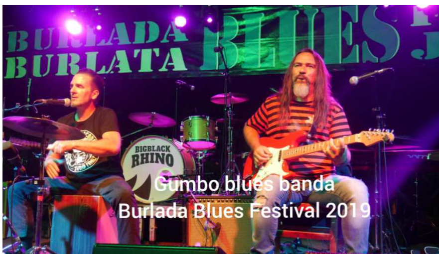
Gumbo blues banda Burlada Blues Festival 2019